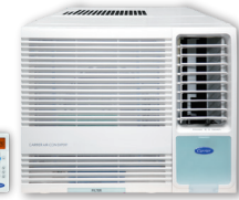
淨冷抽濕遙控型 (EPE系列)